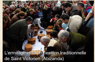
L'ermitage et la procession traditionnelle de Saint Victorien (Abizanda)