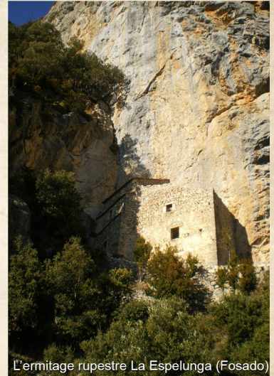
L'ermitage rupestre La Espelunga (Fosado)