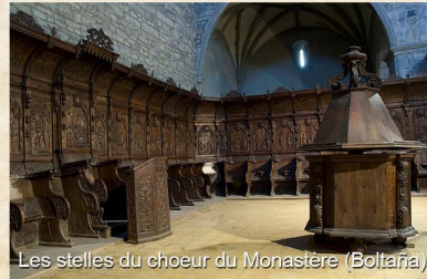
Les stelles du chœur du Monastère (Boltaña)