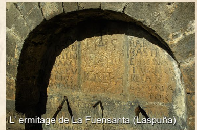
L' ermitage de La Fuensanta (Laspuña)