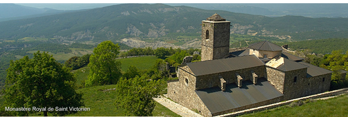
Monastère Royal de Saint Victorien